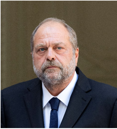
Éric Dupond-Moretti , garde des Sceaux, ministre de la Justice.

En cette période de sortie de crise, où l'Etat continue plus que jamais d'être aux côtés de nos entreprises, je suis convaincu que la justice a un rôle majeur à jouer pour soutenir toutes celles et ceux qui, individuellement ou collectivement, font au quotidien notre économie et contribuent à sa croissance.